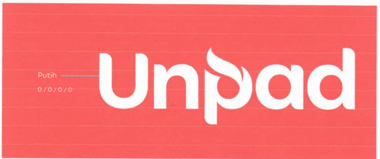
Gambar 4 - White Reverse