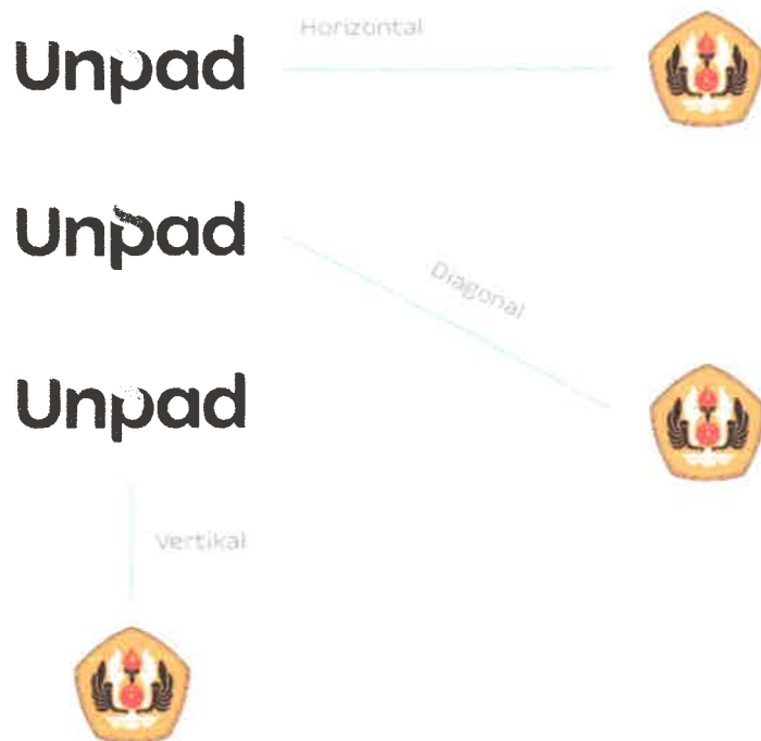
Gambar 6 - Posisi Co-Branding

Posisi logo sekunder Unpad harus selalu berseberangan dengan posisi emblem (horizontal, diagonal, vertikal). Saat digunakan bersamaan dengan emblem, logo sekunder Unpad memiliki batas pemakaian 60-80% dari ukuran tinggi emblem, disesuaikan dengan kebutuhan penggunaan.