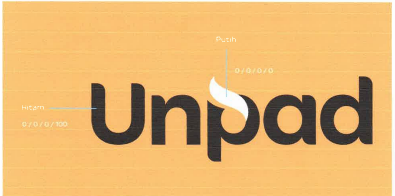
Gambar 2 - Black Reverse Logo