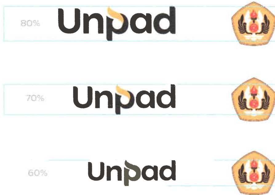
Gambar 5 - Posisi Co-Branding